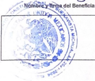
Sello del Sistema DIF Municipal

Nombre y Firma de la Presidenta Sistema DIF Municipal